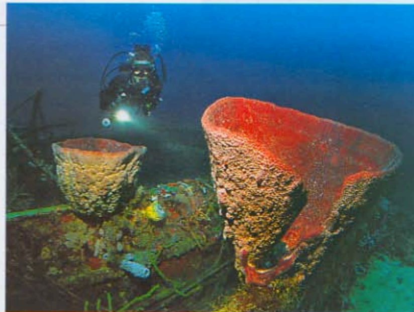
Schwämme am Schiffswrack: Große Vasen-Schwämme siedeln häufig auf exponierten Regionen der Wracks

Wrack der Veronica (Karibikseite) - Die Veronica wurde im Zuge des Ausbaus des Kreuzfahrtdocks in St. George's erfolgreich von ihrem alten Rastplatz inmitten eines schönen Riffs verlegt. Mit ihr sind aller Bewuchs und Kleinlebewesen (unter anderem ein Krötenfisch) umgezogen. Der Platz ist allerdings sehr strömungsreich; dafür aber haben sich mittlerweile etliche Weichkorallen am Wrack angesiedelt. Tiefe: 15 m – 18 m