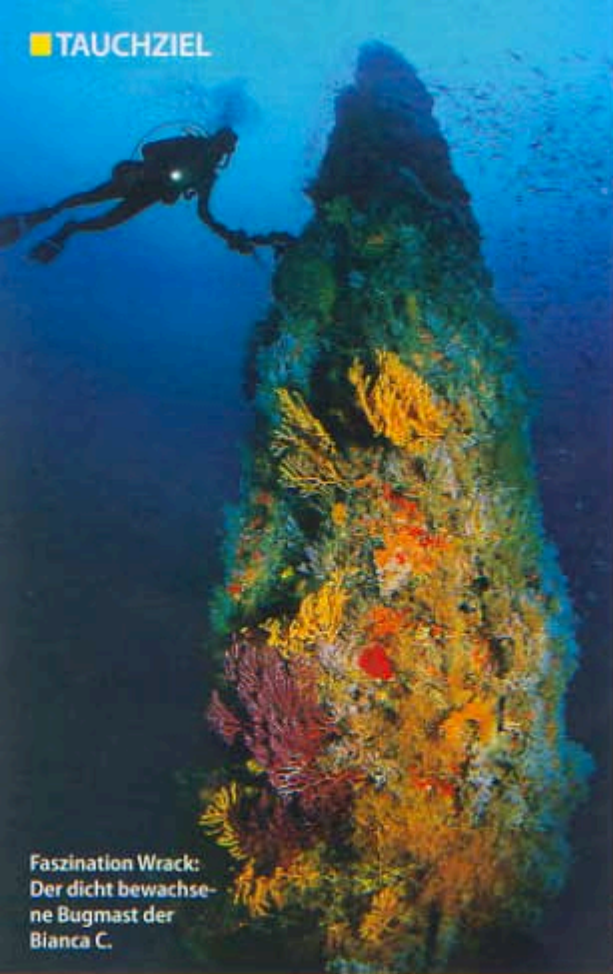
Faszination Wrack: Der dicht bewachse- ne Bugmast der Bianca C.